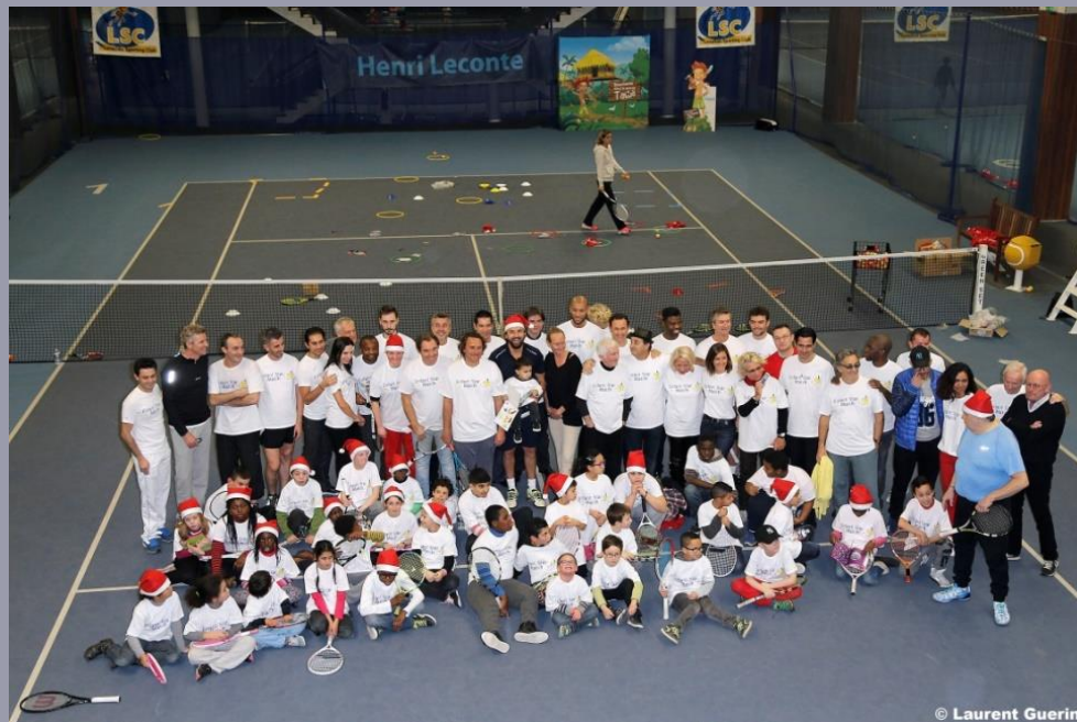
Sourire Gagnant au LSCT