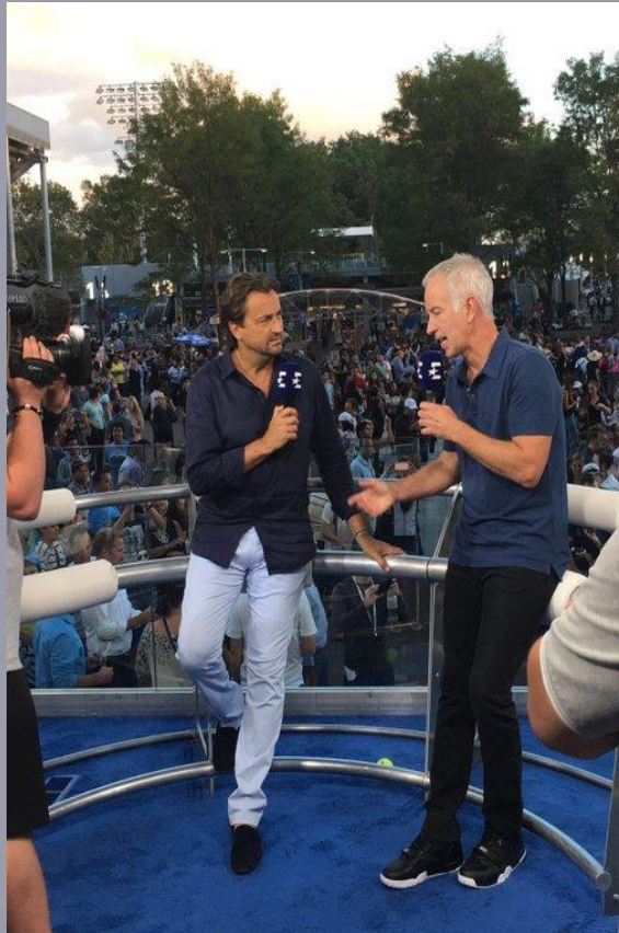
US Open avec John McEnroe