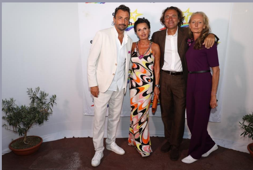
Gala Enfant Star et Match à Monaco